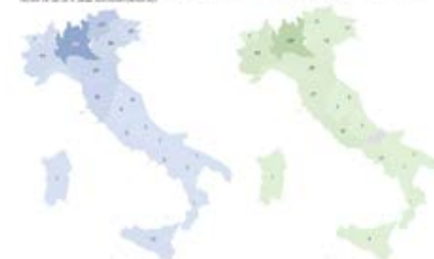
GRAFICO 1 La distribuzione regionale delle imprese ultracentenarie (da 100 cooperative e more, in verde) e SDPA (in blu)

Rintracciare la presenza e la rilevanza della cooperazione e in particolare di Legacoop all'interno del ristretto circolo delle imprese italiane ultracentenarie. È l'obiettivo della ricerca realizzata dall'AreaStudi Legacoop sulle imprese che nella loro storia hanno avuto la capacità di rinnovarsi e adattarsi ai cambiamenti degli scenari di riferimento e rappresentano per questo un modello imprenditoriale di successo. Attraverso un'analisi descrittiva dell'universo delle imprese italiane di capitali, con data di costituzione disponibile e antecedente al 1923, si è cercato un riscontro empirico alla conclamata maggiore longevità delle imprese cooperative (Burdín, 2014 e Tortia, 2018)